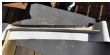
Das Laminat mit Schaumgummimatte und Kunstlederbespannung

Dazu wird die Polyesterform mit Patex vollflächig bestrichen. Anschließend wird die grob und überlappend ausgeschnittene Matte aufgeklebt. Wenn der Kleber ausgehärtet ist, können die überstehenden Schaumgummiflächen sauber abgeschnitten werden.