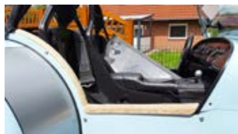
Das angepasste Laminat