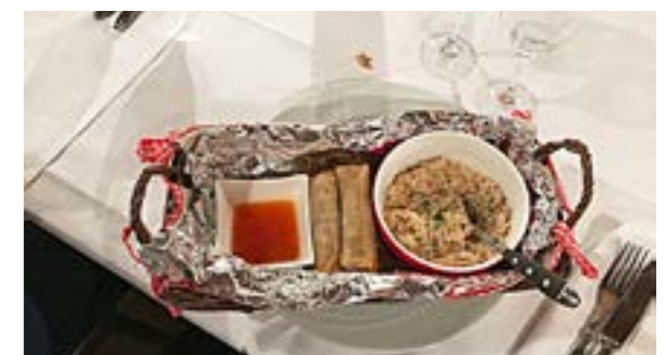
Oben: Menü Vegi - Unten: Menü Zander Filet