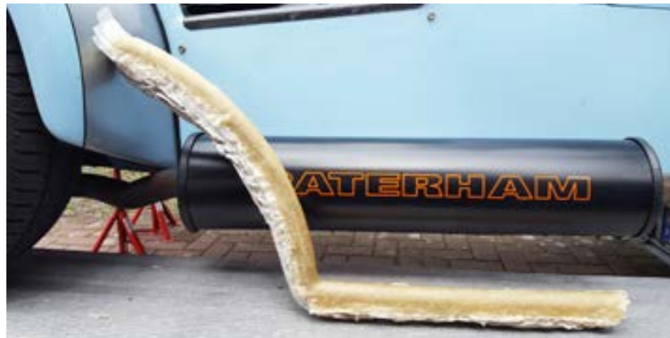
Die Positiv-Gipsform mit dem Polyesterlaminat