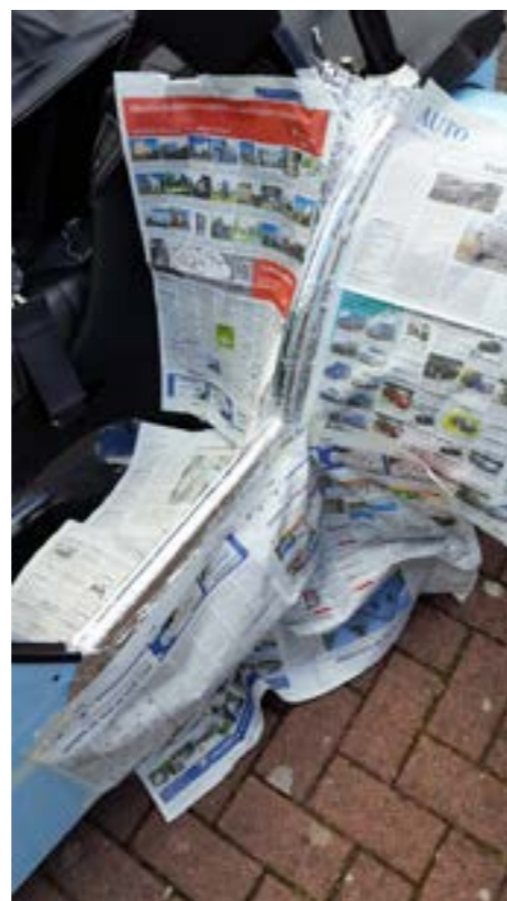
Abdeckung der Karosserie

wasserlöslich ist, bzw. nach dem Abbinden keine Verbindung mit Blech eingeht. Nur auf Stoff (falls vorhanden) sollten man den Gips nicht unbedingt tropfen lassen.