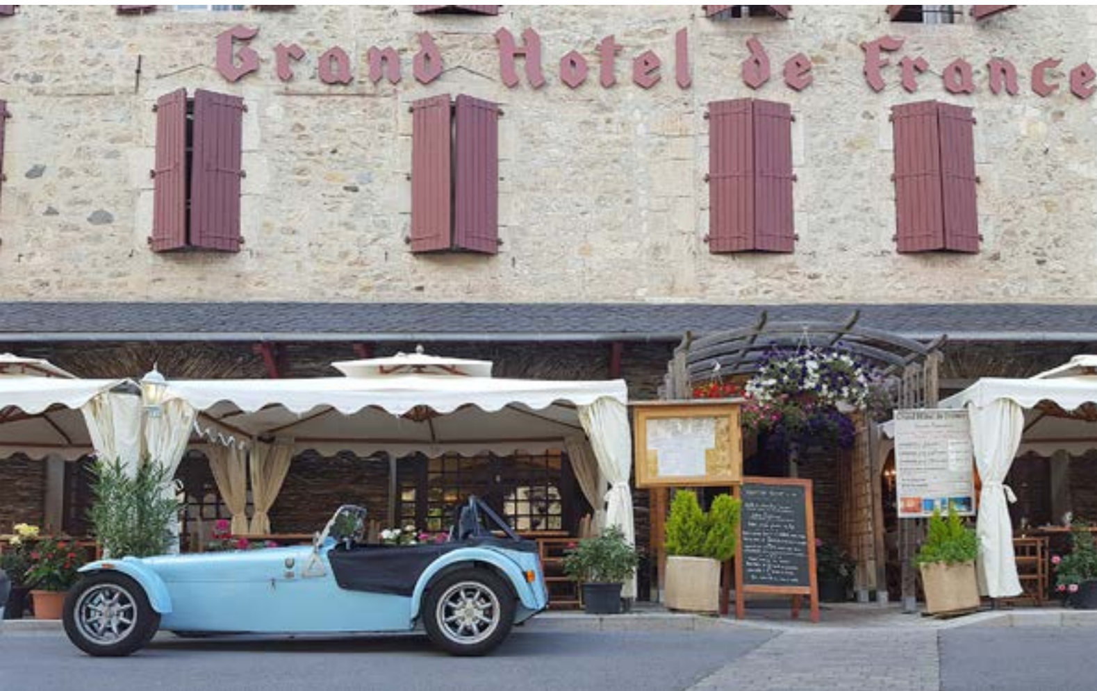
von Ulrich Helms

Irgendwann in den 60ern, es gab gerade ein drittes Fernseh-Programm, sah ich an einem Samstagabend, die Eltern waren im Theater, einen eigenartigen Agentenfilm, "Nr.6". Da fuhr dieser renitente Agent im Vorspann ein absolut geiles Auto (das Wort "geil" gab es damals noch nicht). Ich schaute den ganzen Film, denn ich wollte dieses "Cabrio" wieder sehen. Aber nichts! Zum Glück stellte es sich als Serie heraus und eine Woche später konnte ich wieder ungestört vor der Glotze sitzen. Allein wegen des Lotus. Das es sich um dieses Fabrikat handelt, das hatte ich durch blättern in diversen Autozeitingen inzwischen herausgefunden. War nicht so einfach, "googeln" war noch nicht erfunden worden.