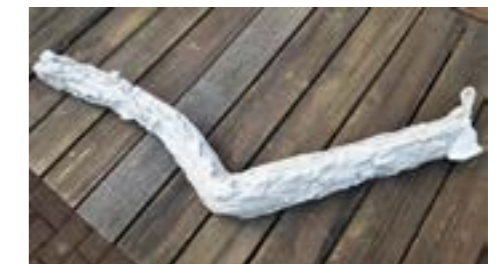
Positiv- und Negativ-Gipsform