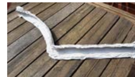
Die abgenommene Negativ-Gipsform

Jetzt muss der Gips abbinden und aushärten.