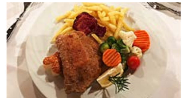
Menü Cordon Bleu