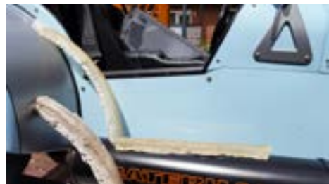
Das unbearbeitete Laminat

Nun kann die Polyesterform auf der Positiv-Form hergestellt werden. Dazu werden kleine Portionen von Polyester und Härter angemischt. Die Glasfasermatten werden mit dem flüssigen Polyester getränkt und von Hand mit Gummihandschuhen und/oder Pinsel auf die Positiv-Gipsform laminiert. Die Menge des anzumischenden Polyesters muss man austesten. Je nach dem, wie schnell man arbeiten möchte. Also erst mal eine geringe Menge ansetzen und danach gegebenenfalls die Menge vergrößern. Aber Achtung, dass Zeug härtet schnell aus. Das Verhältnis Polyester und Härter genau nach Herstellerangaben